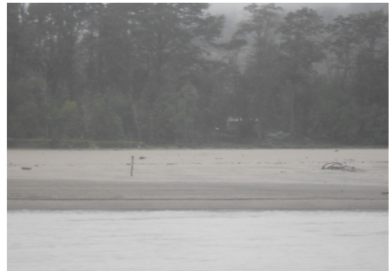
Figura 4 Curva El Pedregoso o Las Corrientes de Méndez.