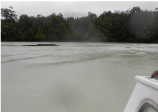
Figura 3 Piedra Chodil.