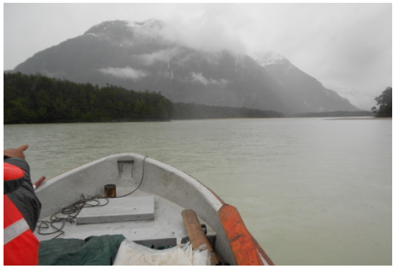
Figura 8 Punta Canelo. Fuente: Equipo de investigación.