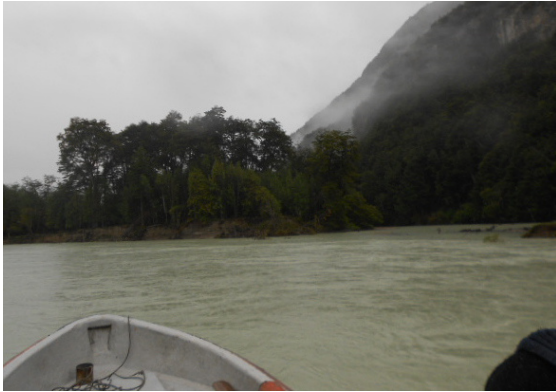
Figura 1 Sector Las Lumas.