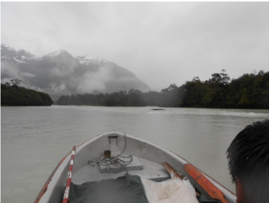
Figura 5 El Rápido Bórquez.