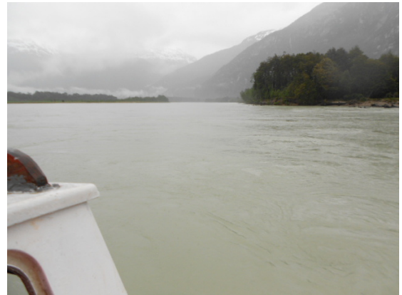
Figura 6 Punta Timón.