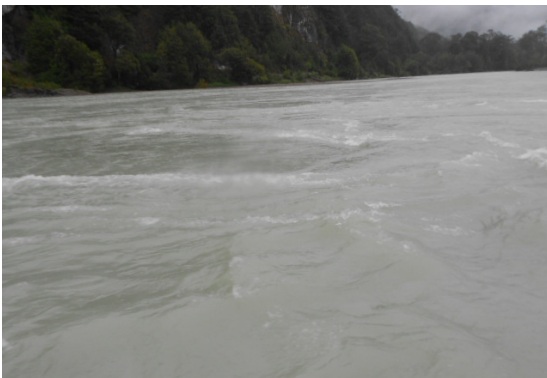
Figura 7 Remolino Grande y Chico.