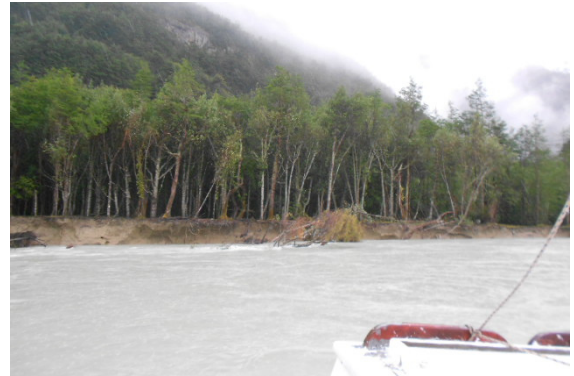
Figura 2 Río Negro y Cerro Volcán.