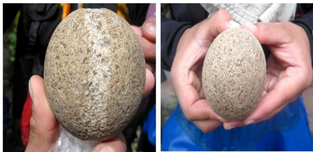
Figura 2. Posible bola de boleadora encontrada en canal Puyuhuapi.

De igual manera se aporta un nuevo dato para la discusión en torno a las dinámicas de ocupación de este territorio, en cuanto a unir dos esferas culturales que hasta poco tiempo se creían separadas y sin conexión. Situación que con los últimos hallazgos se pone en tela de juicio.