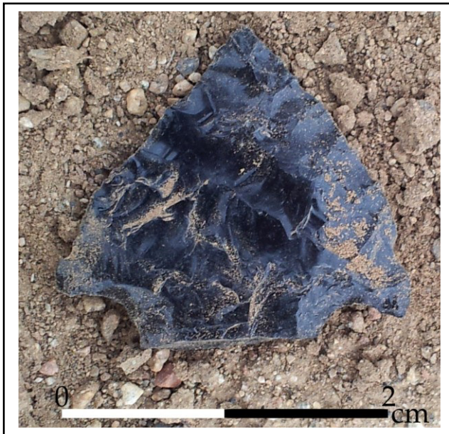
Figura 1. LB4. Punta de proyectil con pedúnculo quebrado.

Si bien de LB2 a LB12, se consideraron sitios diferentes por la distancia entre ellos (entre 15 a 20 m), varios son hallazgos aislados (figura 3), y la distinción resulta ser solo operativa, pues es más probable que todos sean reflejo de ocupaciones dentro de un mismo sistema de relaciones sociales sobre la terraza en la que se encuentran también los sitios LB9 a LB11. La sedimentación estaría cubriendo los demás vestigios, ocultos en pleno bosque deciduo transición a estepa.